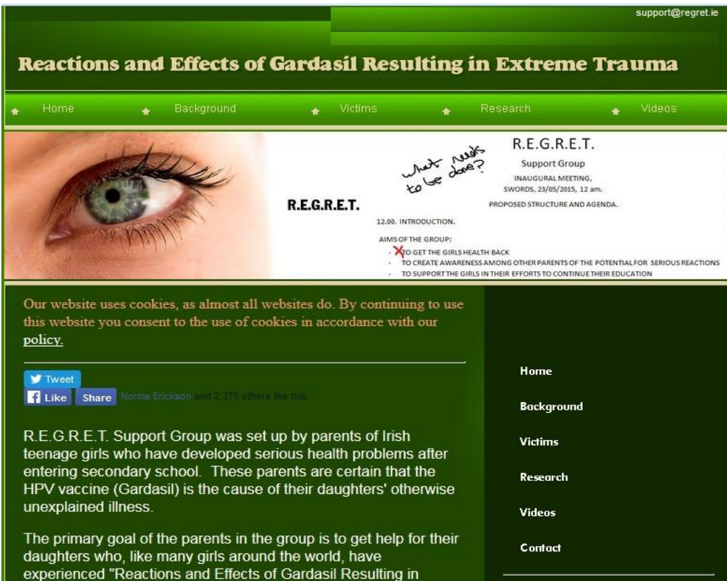
アイルランド HPV ワクチン被害者会ホームページ R.E.G.R.E.T.の意味は「後悔する」