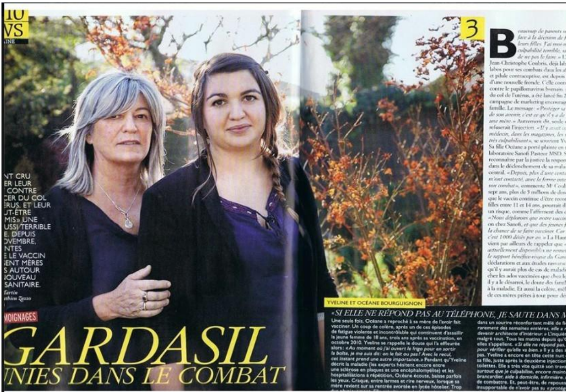
フランス 裁判等被害者が訴えと抗議活動を行っている